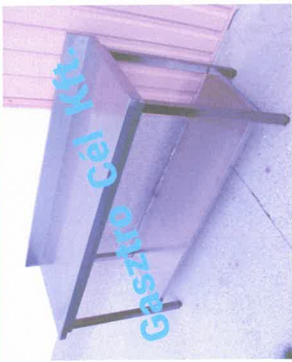
Rozsdamentes munka és feldolgozóasztalok, polcok, hátsó felhajtással. Minden asztal AISI304 rozsdamentes acélból, színtezhető lábakkal készül.